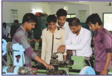
Well-equipped and modern workshop with latest machines and tools