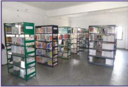
Well stocked library with spacious reading room